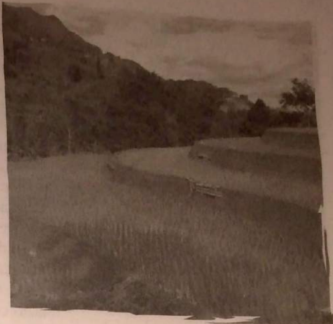
La agricultura artesanal se adapta a las condiciones del terreno.

La agricultura de Asia se puede calificar como una agricultura "de contrastes"; por una parte, existen regiones con una agricultura tradicional que no ha incorporado nuevas técnicas y casi todo el trabajo es manual, por lo que requiere una gran cantidad de mano de obra. En otras regiones se presenta una agricultura de subsistencia, orientada a satisfacer las necesidades de los campesinos, quienes sólo dedican una mínima parte de su cosecha al comercio; por último, existe una agricultura comercial de gran tecnificación y altos rendimientos, con excedentes destinados a la exportación.